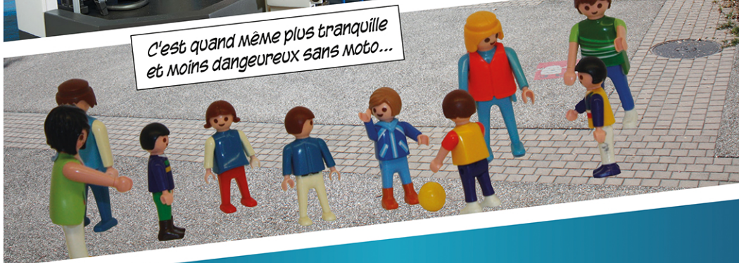
C'est quand même plus tranquille et moins dangereux sans moto...