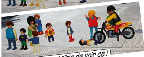
C'est pas possible de voir ça!