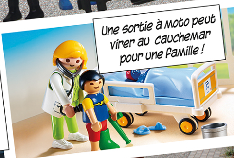
Une sortie à moto peut venir au cauchemar pour une famille!