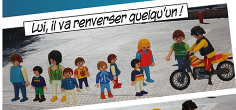
Lui, il va renverser quelqu'un!