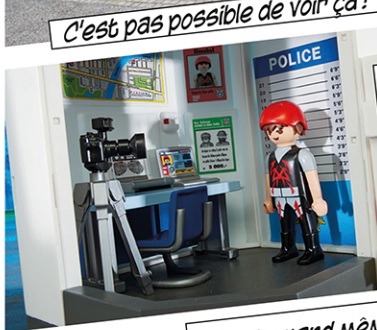
Voilà ce qui peut arriver si vous faites les malins à la sortie des écoles...